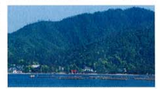
四季を感じる安芸の宮島もすぐそば