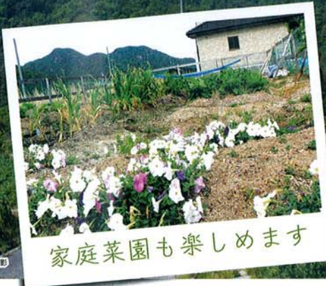
家庭菜園も楽しめます